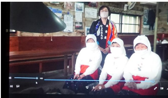
サプライズビデオ上映(協力:はちまんかまど様)