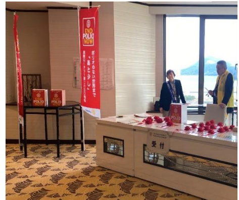
ポリオプラス募金の様子