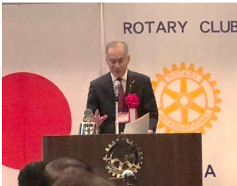
鳥羽市長挨拶: 中村欣一郎氏