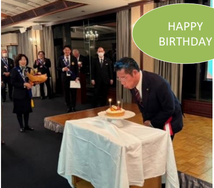
鈴木伊勢市長誕生日おめでとうございます！