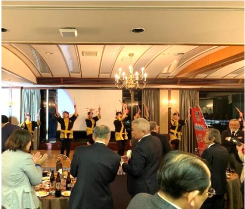
「鳥羽物語」の踊りで会場を盛り上げていただきました！