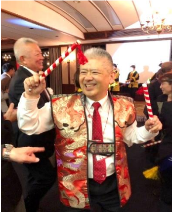
増田AG、陣羽織で登場！！