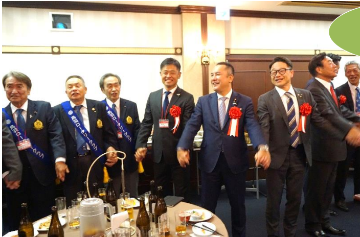
「手に手つないで」 大合唱♪