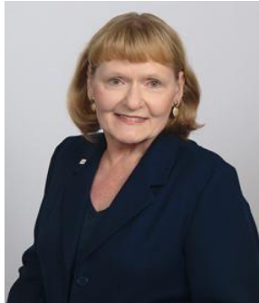
McMurrayロータリークラブ (米国)

2023-24年度会長エレクト McMurrayロータリークラブ 米国ペンシルバニア州