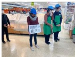
令和6年12月4日 鳥羽一番街防災訓練（消火・避難訓練）