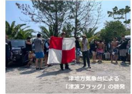
津波防災委員会による「津波フラッグ」の啓発