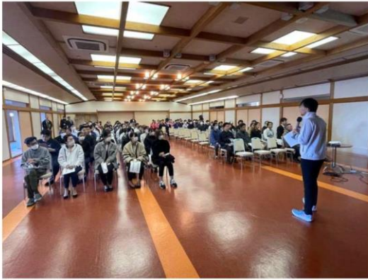
令和6年11月19日 鳥羽旅館事業協同組合（合同避難訓練）