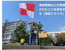
津波警報などが発表されたことを意味する「津波フラッグ」